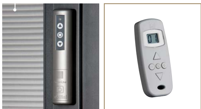
Module batterie • Batterijmodule Télécommande radio • Afstandbediening